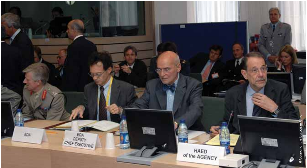
Evropska bezbednosna i spoljna politika: Konsultacije civilnih i vojnih funkcionera EU

Zapadni Balkan, u kojem su definisane ključne oblasti u kojima se može ostvariti saradnja Alijanse i EU u regionu, naglašavajući zajedničku viziju i rešenost koju obe organizacije dele u cilju uspostavljanja stabilnosti na ovom prostoru. U dokumentu se ističe da će na Zapadnom Balkanu obe organizacije usklađeno delovati, izbegavajući pri tome neprijatna iznenađenja i deleći zajedničku viziju za budućnost regiona. U osnovi te vizije stoji samoodrživa stabilnost zasnovana na demokratskim i delotvornim vladinim strukturama i održiva tržišna privreda. Prema ovom dokumentu, ključne oblasti za usklađen pristup NATO i EU u podršci stabilnosti i bezbednosti u regionu su: prevencija sukoba i krizni menadžment; reforma sistema odbrane; jačanje vladavine prava, borba protiv terorizma; granična bezbednost i kontrola naoružanja.