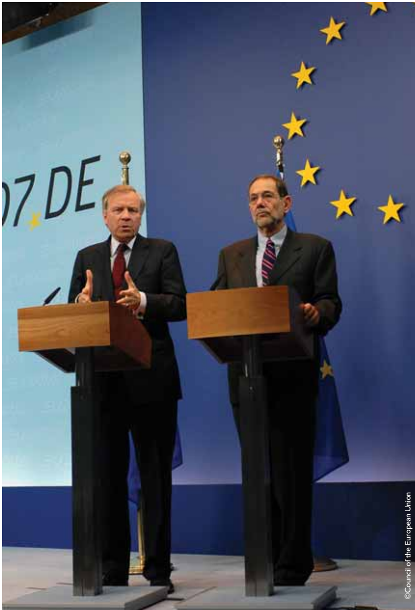
Dijalog čelnika NATO i EU doprineo je razvoju strateškog odnosa dve organizacije

upotrebljene za humanitarne zadatke, protivterorističke akcije, operacije blokade, evakuaciju civila, akcije podrške diplomatiji. NATO snage za reagovanje mogu samostalno delovati ili biti upotrebljene kao prethodnica većih snaga u nekoj operaciji. Oktobra 2006. godine NATO snage za reagovanje postale su potpuno operativne, sa oko 25.000 trupa. Tokom 2005. godine, NATO snage za reagovanje bile su upotrebljene za pomoć postradalima od uragana Katrina u SAD i zemljotresa u Pakistanu.