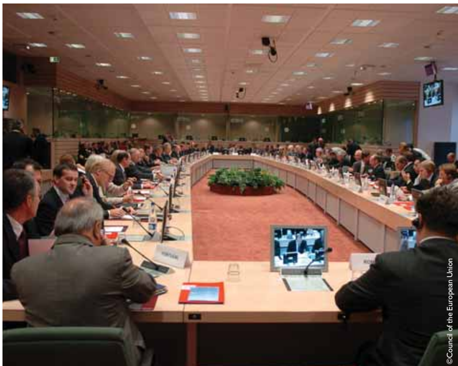
Sastanak Severnoatlantskog saveta i Političko-bezbednosnog komiteta EU

Visoki američki zvaničnici, predvođeni državnim sekretarom Medlin Olbrajt otvoreno su ispoljavali zabrinutost zbog Blerove i Širakove inicijative, za koju su