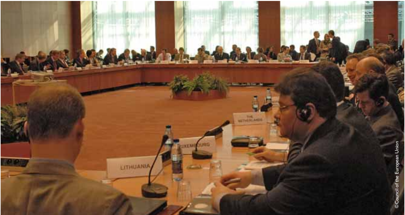
Zapadni Balkan: Tema od posebnog interesa na susretima predstavnika EU i Alijanse

članica NATO-a saglasili su se s ovakvom odlukom EU zasnovanom na Berlin Plus aranžmanima.