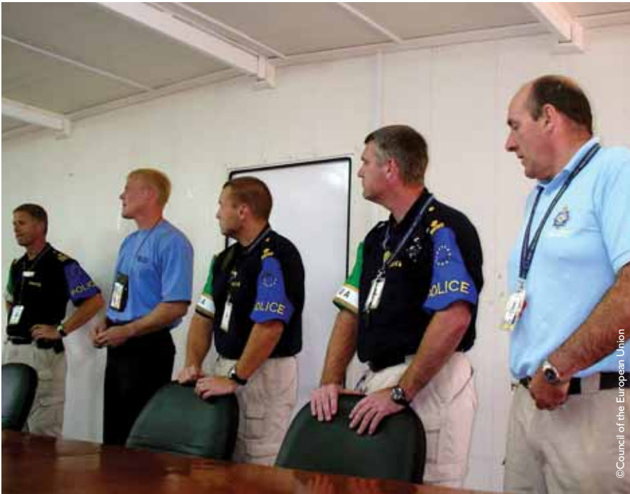
Policijske misije EU pružaju značajan doprinos uspehu stabilizacionih operacija

Ipak, prevlađuje mišljenje da će razvoj Evropske bezbednosne i odbrambene politike samo dopuniti, možda čak i ojačati NATO. U svakom slučaju, osnažice poziciju EU kao kredibilnog spoljnopolitičkog i bezbednosnog činioca na međunarodnoj sceni. Za Evropsku uniju je veoma važno da poseduje autonoman kapacitet da pokreće svoje vojne operacije u slučajevima kada NATO, kao celina, nije spreman ili nije sposoban da reaguje. Iako i dalje postoji gruba podela prema kojoj je NATO pretežno zadužen za masivne vojne operacije, a EU uglavnom za civilne operacije manjeg ili srednjeg obima, očigledno je da Alijansa u poslednje vreme pokreće i manje humanitarne misije i misije za obuku, dok se EU sve više upušta u ozbiljne vojne operacije.